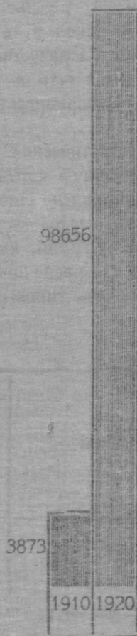
Диаграмма № 3.

Учащихся коренных народностей 1910—1920 г. г.