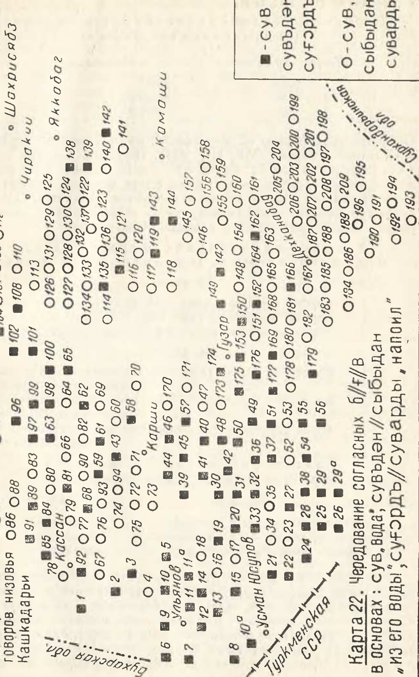
Карта 22. Чередование согласных б//ф//в в основах: сув, вода; субъден // сыбыдан "из его воды", суфурдъ // суварды, напоил"

Дialeктологическая карта узбекских говоров низовья Кашкадарьи