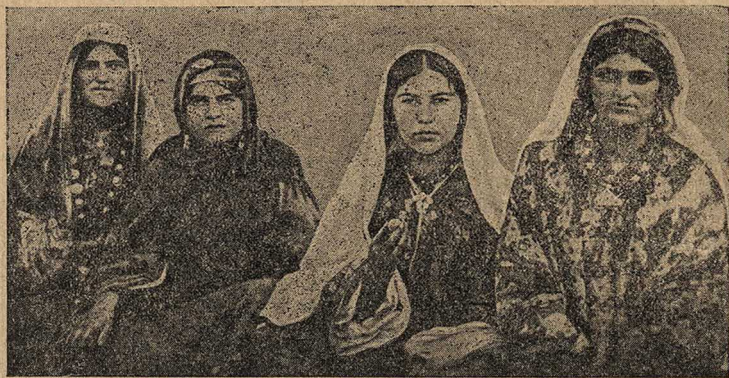
Рис. 2. Типы таджичек Каратегина

Результатом раннего замужества является преждевременное изнашивание организма и повышенная смертность женщин, так как женщина в семье несет большую работу по хозяйству и уходу за детьми.