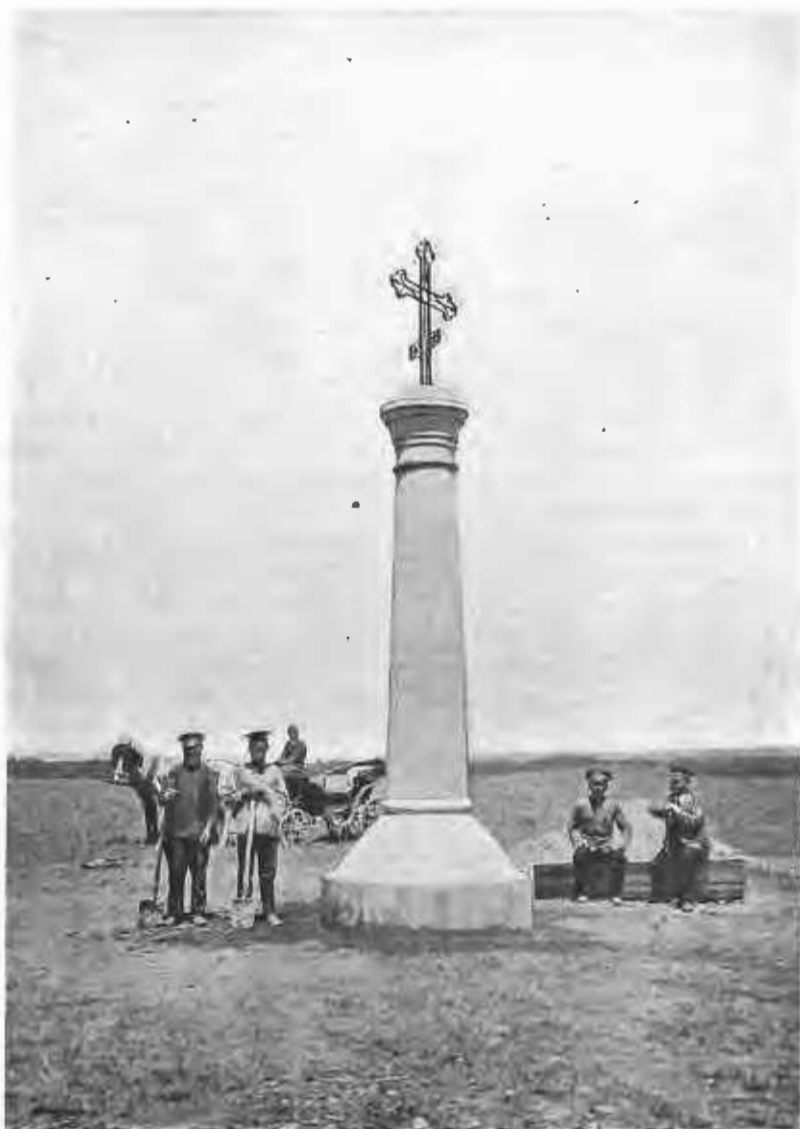
Памятникъ въ одной верстѣ отъ горъ Чимкента на мѣстѣ русской батареи, стрѣлявшей по крѣпости въ 1864 году; внутри похоронены 9 русскихъ солдатъ.

Разведенный же его заботами скверъ скоро разросся и сталъ украшеніемъ города.