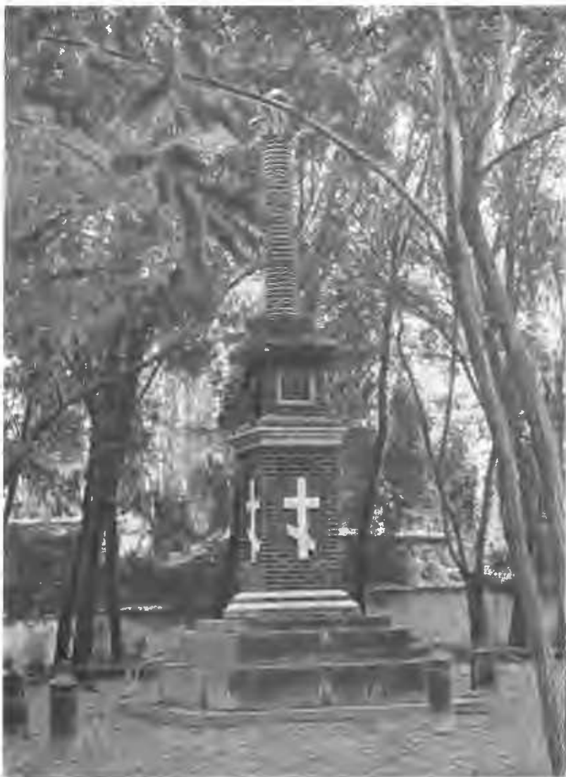
Памятникъ въ гор. Аулиеатѣ въ память взятія его 4-го іюня 1864 г. отрядомъ полковника Черняева.

сентября. Къ этому же дню приурочивается и освященіе вновь выстроеннаго соборнаго храма. Проектъ памятника разработывается мѣстнымъ художникомъ, составителемъ проекта памятника Кауфману въ Ташкентѣ; стоимость сооруженія опредѣляется въ шестнадцать тысячъ рублей.