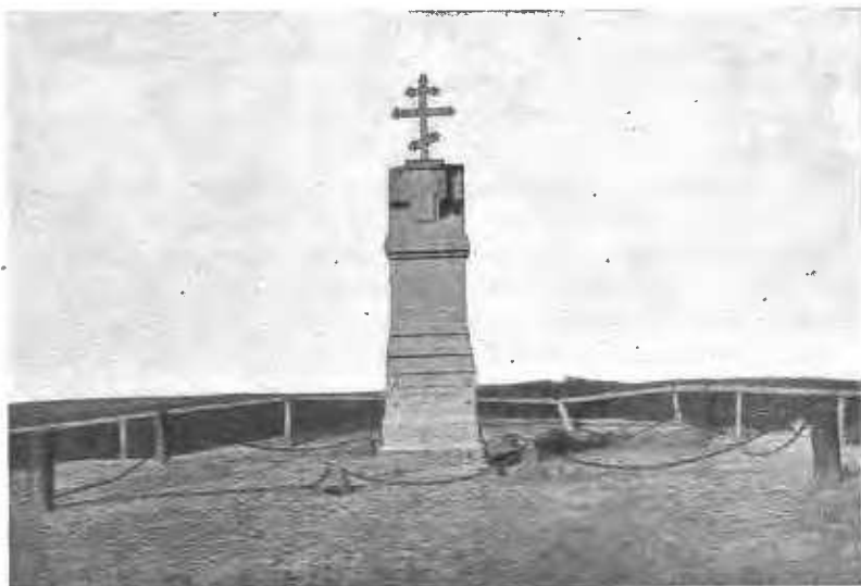
Памятникъ въ гор. Чимкентѣ въ честь воиновъ, павшихъ при взятіи крѣпости 22-го сентября 1864 г., сооруженъ въ 1889 г.

Открытие этого памятника было приурочено и состоялось въ тридцать первую годовщину смерти Константина Петровича и совпало съ сорокалѣтней годовщиной тѣхъ тяжкихъ испытаній, тѣхъ невыносимо мучительныхъ терзаній, которыя пришлось перенести и пережить 3-го и 4-го мая 1873 года туркестанскому отряду войскъ, шедшихъ усмирять Хиву, при переходѣ черезъ Кизиль-Кумскую пустыню, во время остановки на урочищѣ Алты-Кудукъ и которыя чуть не привели къ конечной гибели отряда и къ краху самаго