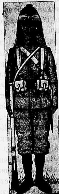
Форма англійскаго солда- та въ Средней Азій.

нее въ бродъ на правый берегъ. По мѣсту переправы 1-я рота открыла учащенные залпы взводами, результаты которыхъ были ужасны: люди, лошади валились въ рѣку, быстрымъ потокомъ переворачивало трупы и уносило внизъ по тече-