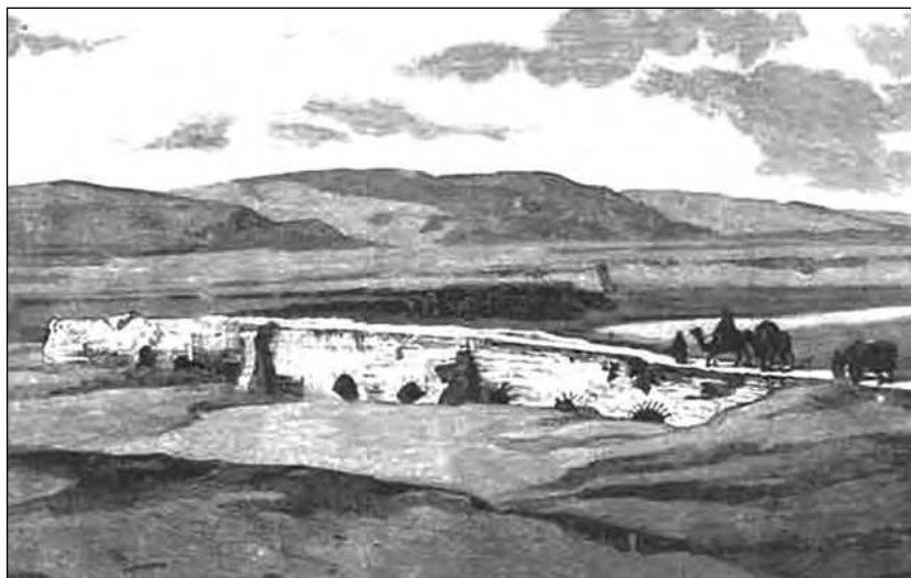
Вид на долину Кушка и каменный мост Таш-Кепри

Тогда Комаров послал ультиматум афганскому генералу с требованием очистить левый берег Кушки и отойти за Мургаб. Но тот отказался выполнить русские требования, сославшись на