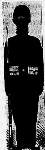
Форма афганскаго пѣхотинца.

Сбитые съ высотъ афганцы, отступившіе въ долину Кушки послѣ попытки прорваться по лѣвому берегу вверхъ по Кушкѣ, бросились черезъ