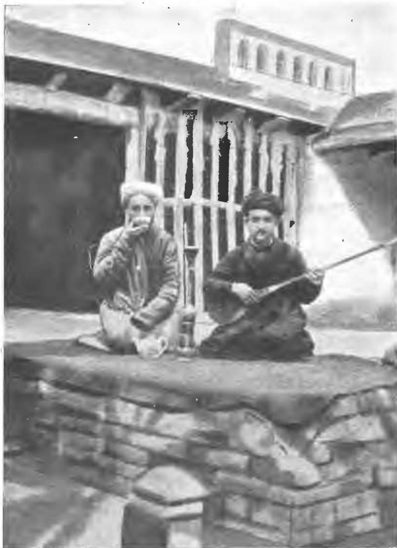
Въ туземной чайной.

переходить въ собственность при неисполненіи обязательства, но если онъ будетъ проданъ до истечения срока, то должникъ имѣеть право получить отъ залогодержателя всю сумму, которую тотъ получилъ при продажѣ.