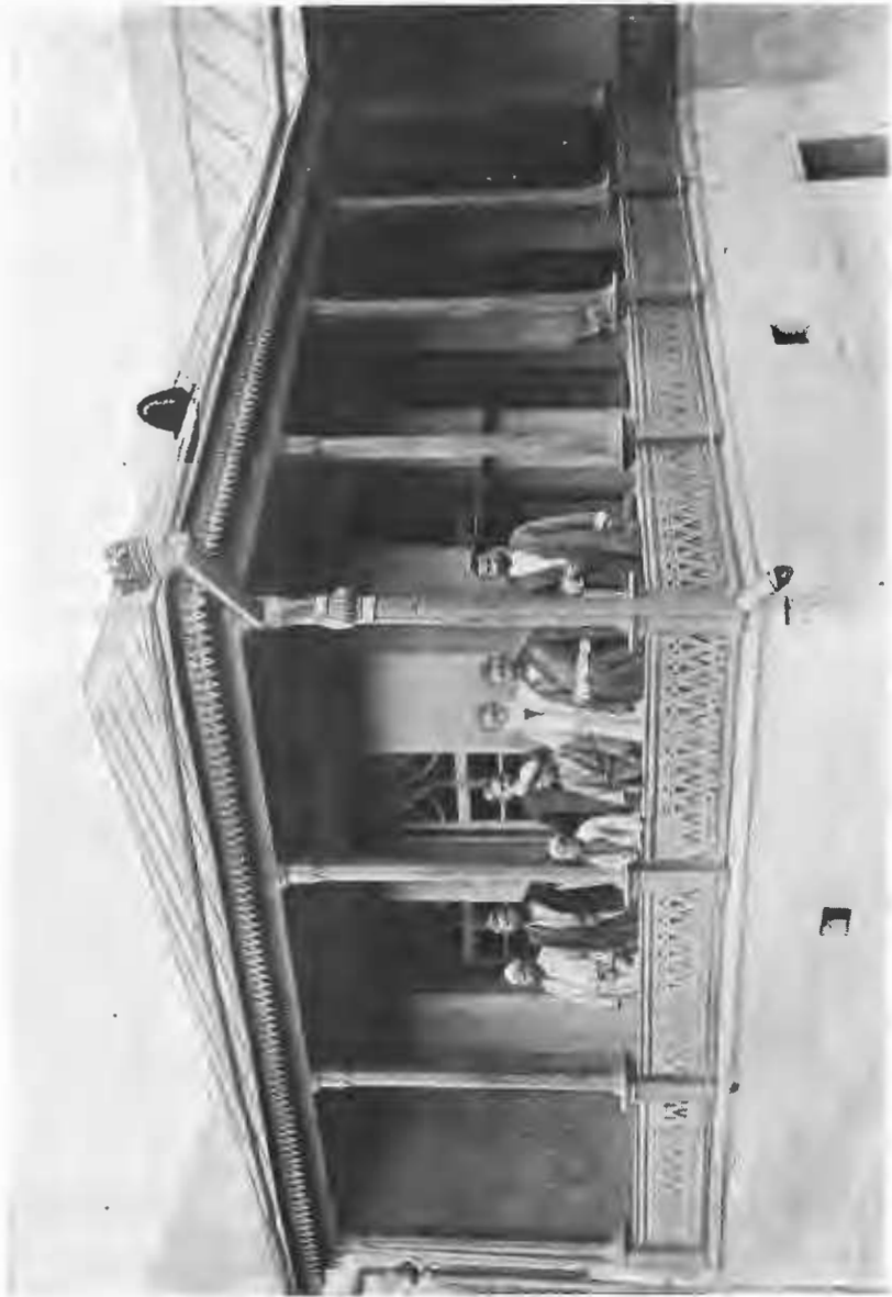
Домъ сарга-торговца въ кишлакъ Хумсанъ.