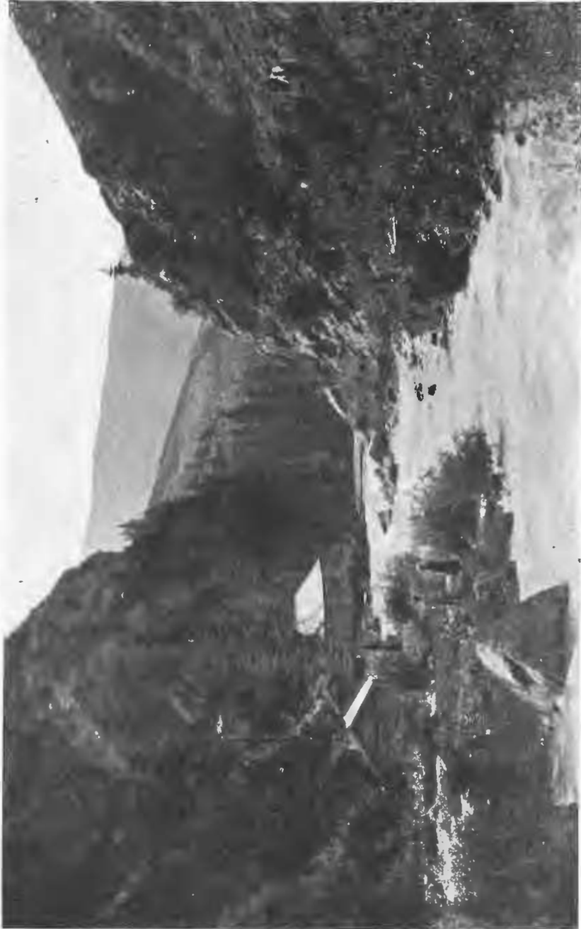
Видъ горной щели въ Заилійскомъ Алатау.