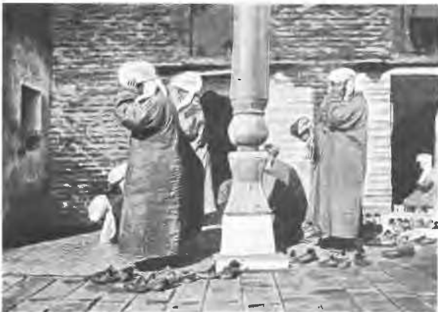
Муллы на молитвѣ.

Жители селенія развели прекрасные сады и огороды. Съ особой любовью они устроили сплошныя бесѣдки изъ поднятаго и пущеннаго вверхъ по переплету изъ прутьевъ винограда, и въ садахъ ихъ можно найти и персики, и яблони, и груши, и много другихъ плодовъ и ягодъ, а въ огородахъ—всѣ прелести богатаго юга: