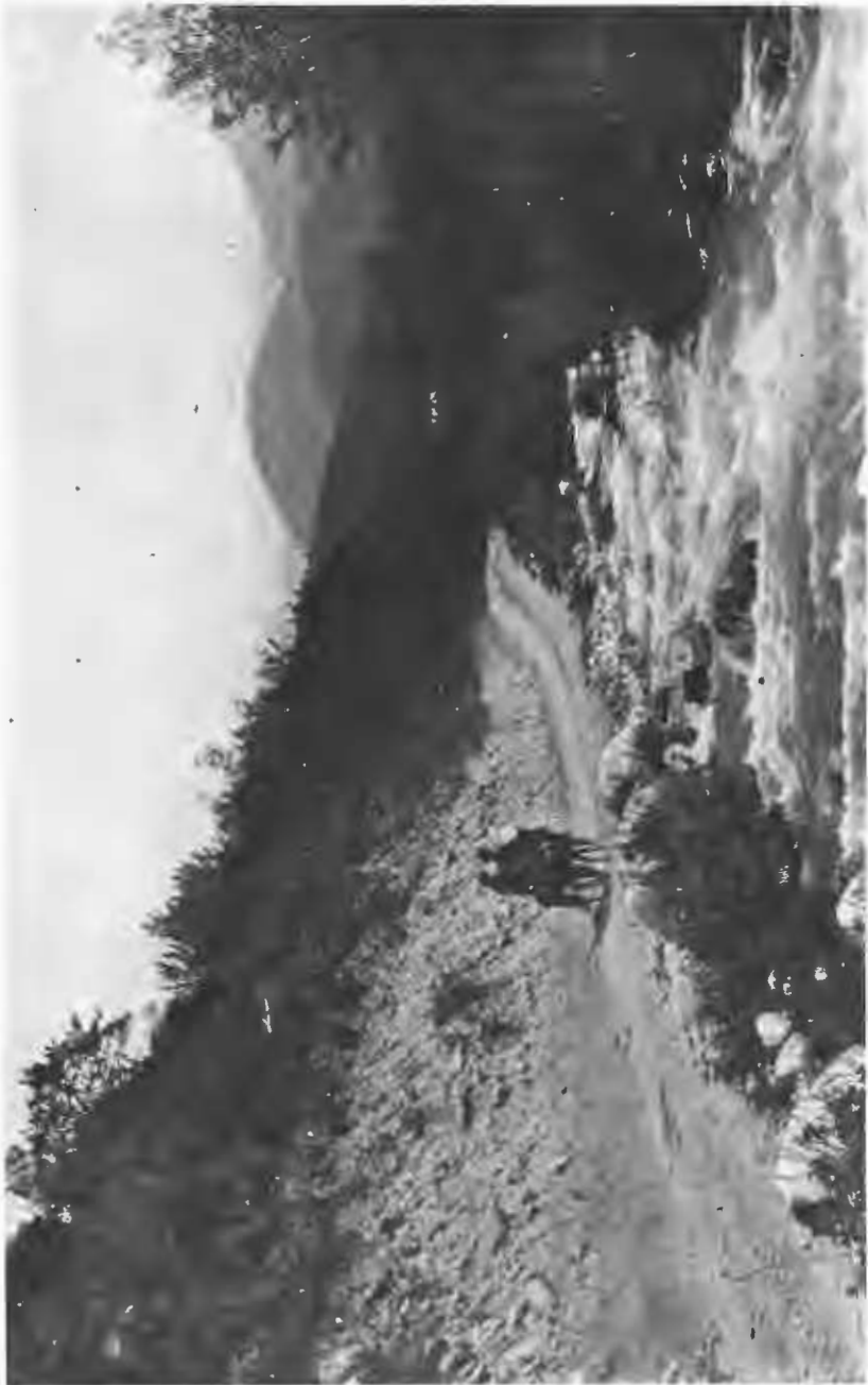
Окрестности города Върнаго.