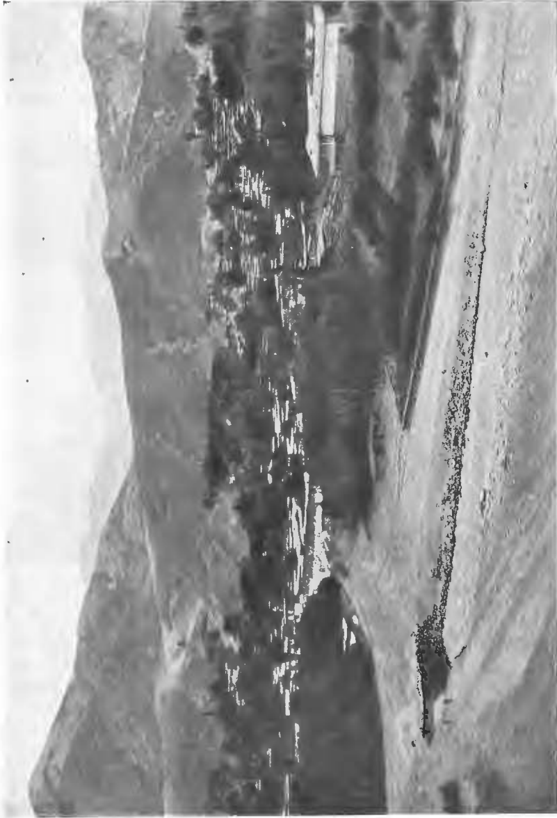
Видъ туземнаго кишлака.