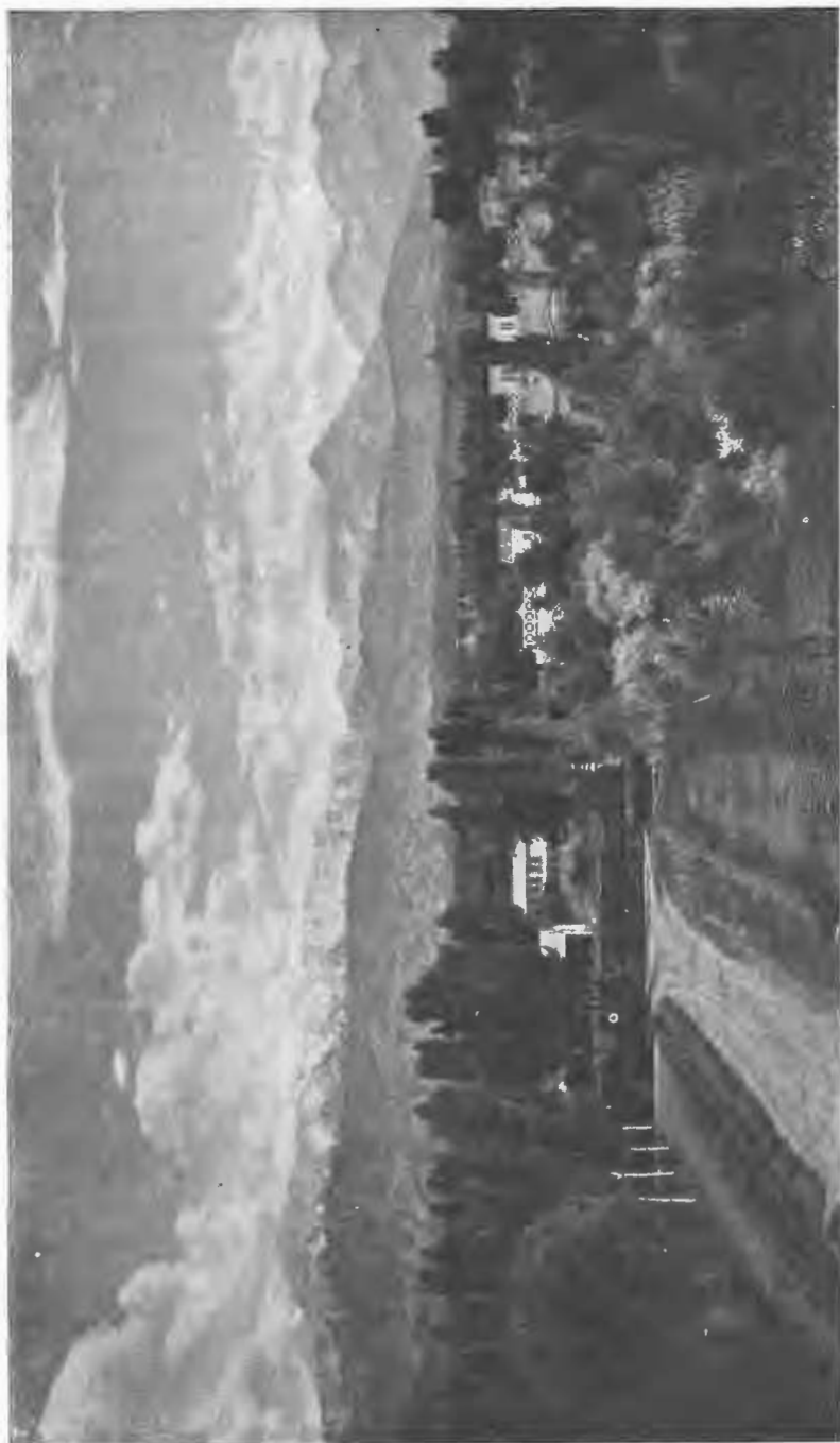
Видъ города Вѣрнаго.