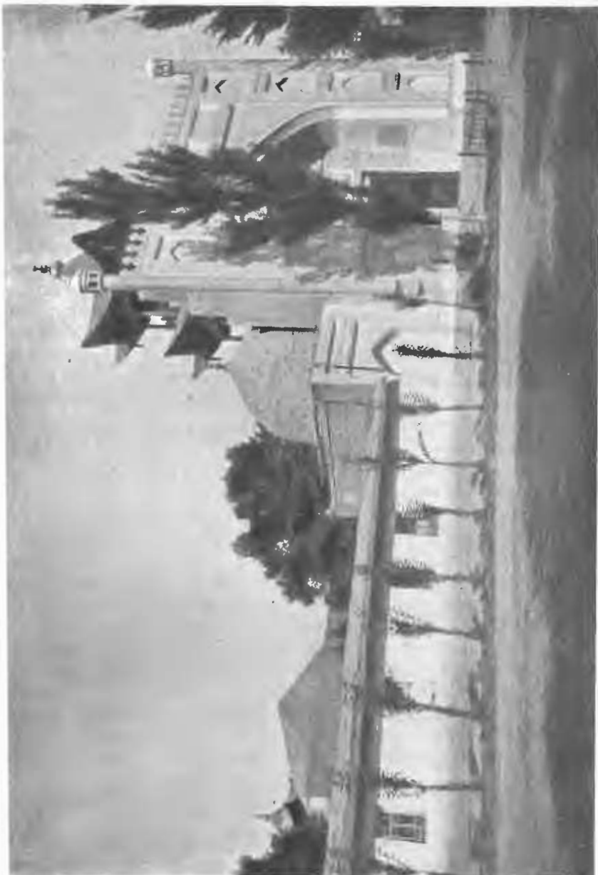
Мечеть въ Джаркентѣ.