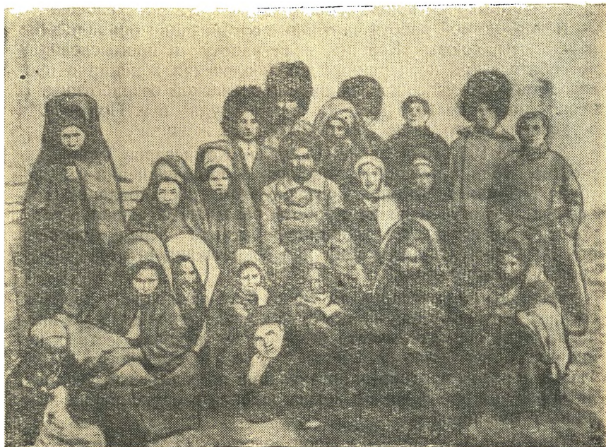
1-я волостная конференция женщин-туркменок Отамышского района, Мервского уезда. 1924 год.

мов, Советов, партийных ячеек, организаторов по работе среди женщин. Было проведено 22 волостных и 1 областная женская конференция, собрания туркменок более чем в 100 аулах 1 .