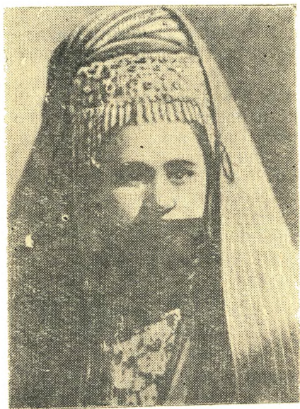
Туркменка в борике, пуренджеке и яшмаке.

Все это коран предписывает как средство «освежения» взглядов женщины (статья 51 главы XXXIII). Коран требует от жен и дочерей, исповедующих ислам, «спускать покрывало