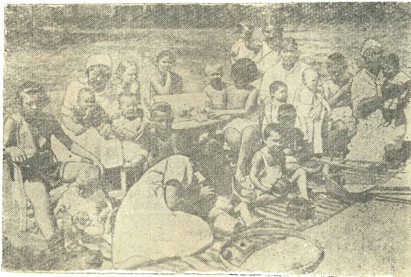
Детский сад и ясли для детей слушательниц курсов переподготовки женработников при Средазбюро ЦК ВКП(б) в 1928 году в г. Ташкенте.

го выдвижения женских коммунистических, а также беспартийных кадров, особенно среди работниц, на самостоятельную руководящую работу в партийных организациях, профсоюзах, Советах и т. д.