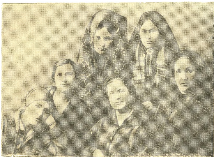
Группа работниц женотделов партийных комитетов Туркменистана, 1926 год.