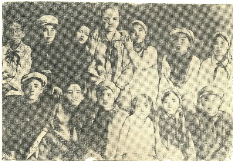
Интернат им. Эне Кулиевой после объединения с детдомом им. Ильбаева. 1931 год.

По мере преодоления затворничества женщин и девушек и феодально-байского отношения к ним со стороны мужчин, отпадала необходимость в подобных обособленных женских организациях. Партия направляла работу таких организаций к постепенному слиянию их с общими комсомольскими, пионерскими организациями, клубами, школами ликбеза, производственными бригадами и т. д. Так, например, в 1931 году интернат (для девочек) имени Эне Кулиевой был объединен с интернатом (для мальчиков) имени Ильбаева.