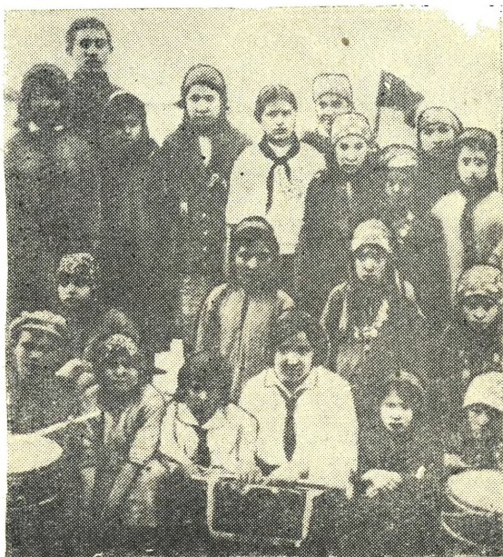
Первый интернат для девочек-туркменок им. Эне Кулиевой. Полторацк, улица К. Маркса, 9. 1925 год.