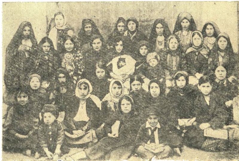
Группа женщин—членов Советов, делегаток Красноводской районной конференции, состоявшейся в 1927 году.

Партия настойчиво и терпеливо разъясняла, что социалистическое строительство, вызвавшее ломку старых, неравных взаимоотношений людей в обществе и в быту, — дело трудное, требующее воли и упорства. Вопрос о вовлечении женщин в социалистическое строительство неоднократно ставился и обсуждался на съездах, конференциях партийных организаций республик, областей, на пленумах партийных комитетов. Неоднократно проводились совещания с работниками женотделов партийных комитетов.