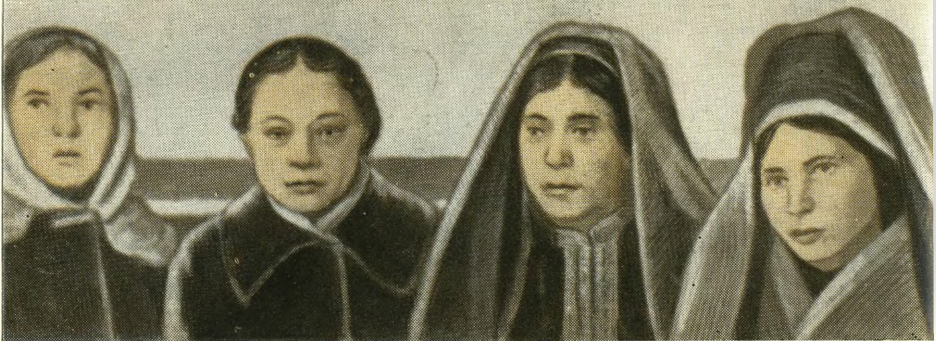
Н. К. Крупская среди туркменок