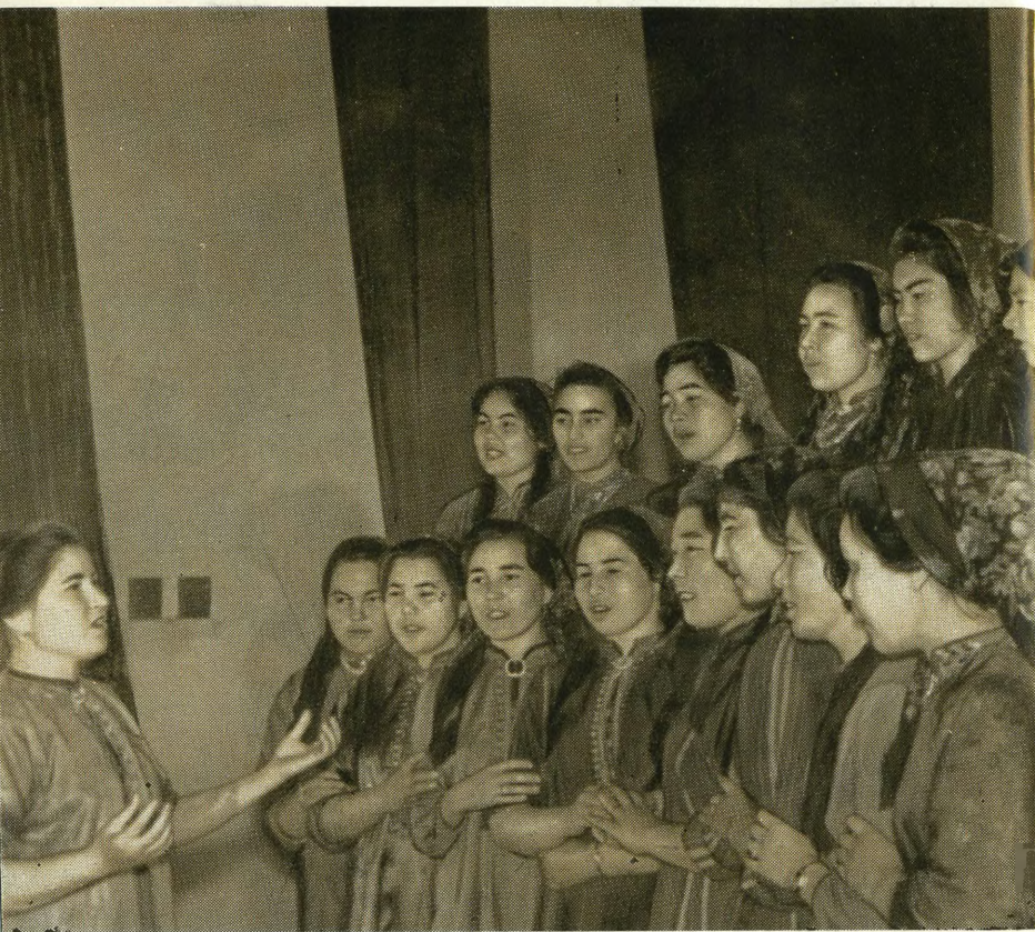
Хор студенток-туркменок Туркменского госуниверситета им. А. М. Горького