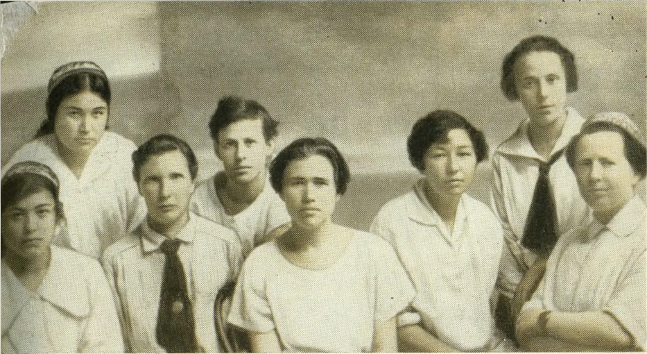
Группа женработниц ЦК КП Туркестана