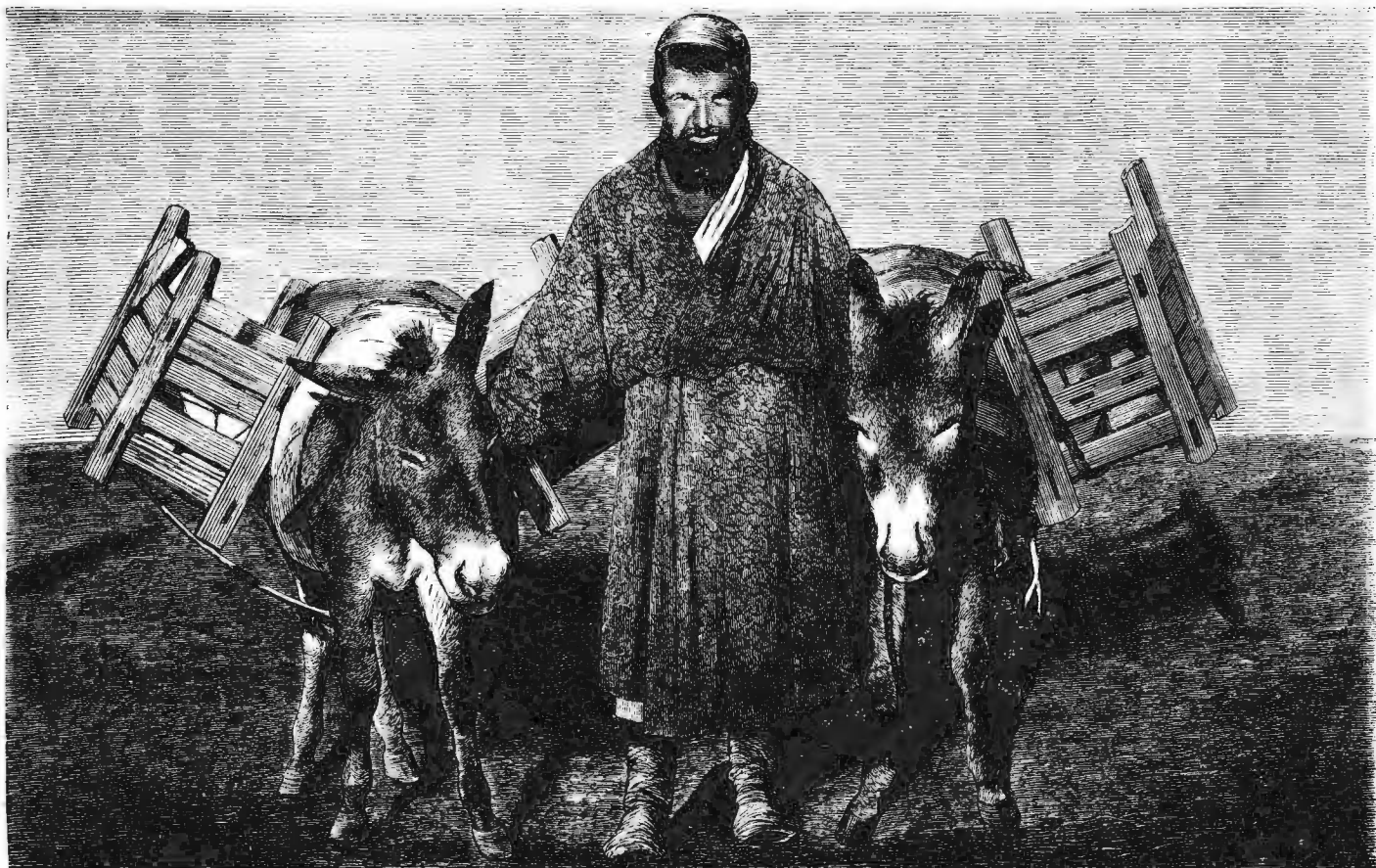
Продавецъ кирпичей въ Средней Азіи.

— Въ самомъ дѣлѣ, ты этого не думала? да?... Впрочемъ, пожалуй, это такъ: что я могу чувствовать, никому дѣла нѣтъ до того... Если я и коснулся этого, то единственно для твоего успо-