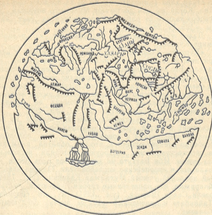
Арабская круглая карта мира (по ал-Идриси, XII в.)

му приплыл в Китай. Через сорок дней, в начале 1347 г., он прибыл в индийский порт Каулем на восточном берегу Аравийского моря, а в конце января переселся в Каликут и намеревался отсюда отправиться в столицу ко двору Мухаммада Туглака, но вскоре переменял намерение. Сев на корабль, Ибн Баттута через 28 дней, в апреле 1347 г., прибыл в Зафар. Из Зафара путешественник отправился в Хормуз. Нигде не останавливаясь, он снова пересек Персию, посетив города Майман, Шираз, Йезд, Исфахан, Шустар и Хувайз. Из Хувайза он направился в Басру и Неджеф, отсюда в Багдад и, наконец, «ровно через двадцать лет снова оказался в Дамаске». Здесь Ибн Баттута пробыл примерно до апреля 1348 г., затем покинул город и через Хаму и Хомс доехал до Алеппо, где был в июне 1348 г. Узнав о том, что в г. Газе, куда он держал путь, свирепствует холера и «ежедневно умирают тысячи людей», Ибн