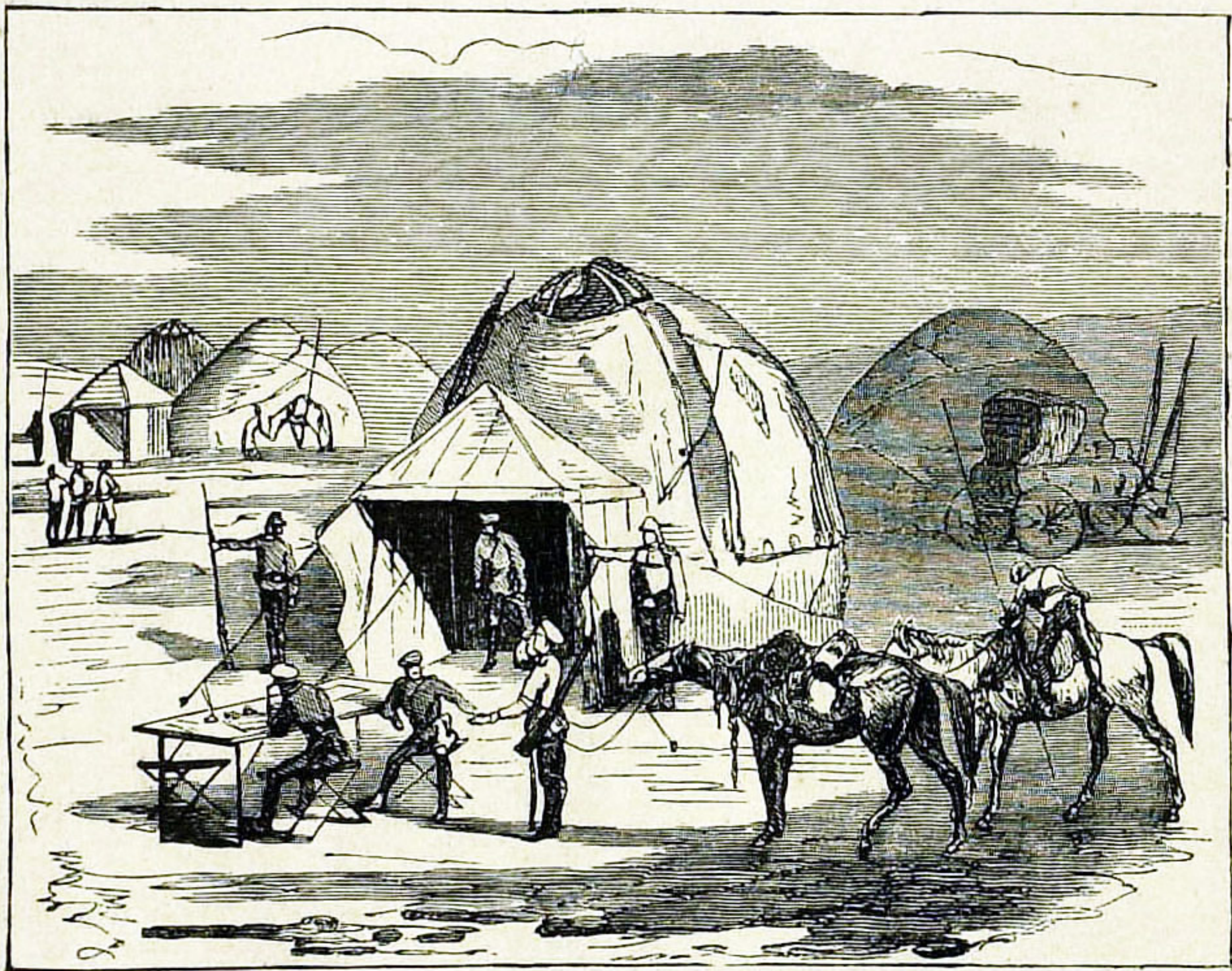
Ставка нашего главнокомандующаго при урочищѣ Хала-Атъ.