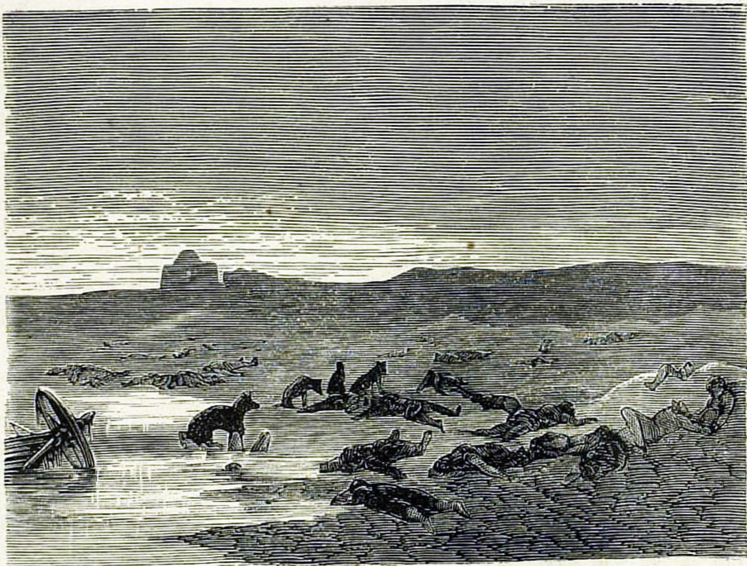
Персіане-рабы, избитые хивинцами по заключеніи мира.