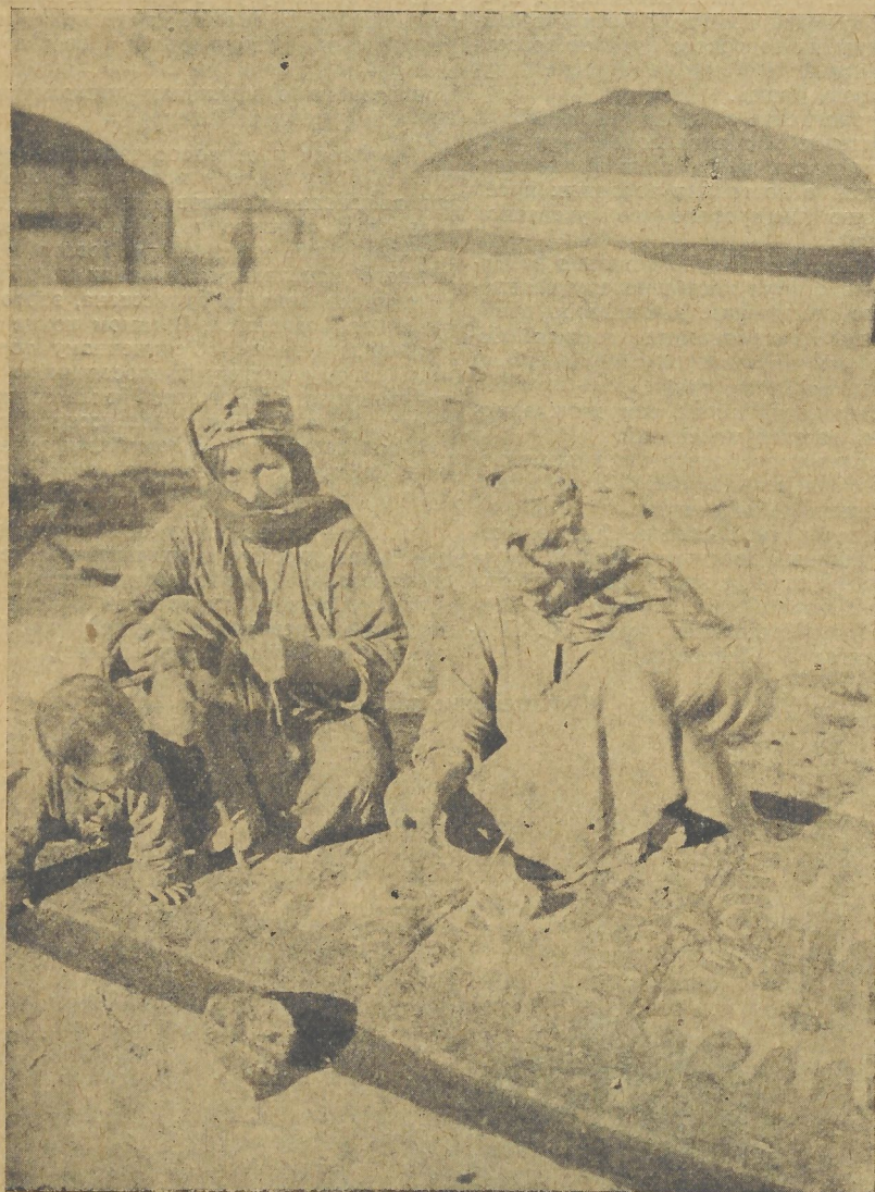
Туркменки (пл. номуд) за выделкой кошмы (войлочный ковер).