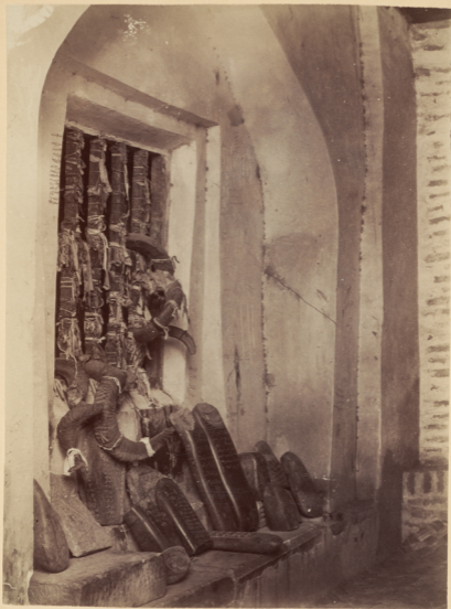
32. Могила Святого Ходжи-Абду-даруна.