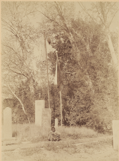
18. Могила Святого Холжи-Ахрара, умершаго въ 895 году геджры (п. Р. X. 1490 году).