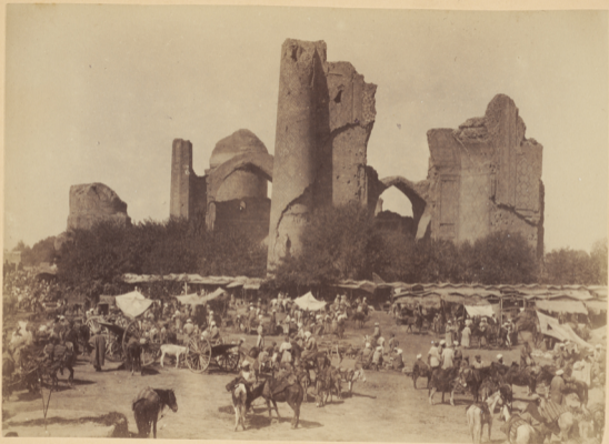
7. Мечеть Биби-Ханымъ. Постройка начата въ 801 г. геджры (п. Р. X. 1398 году) и окончена въ 806 г. геджры (п. Р. X. 1403 году) Эмиромъ Тамерланомъ.