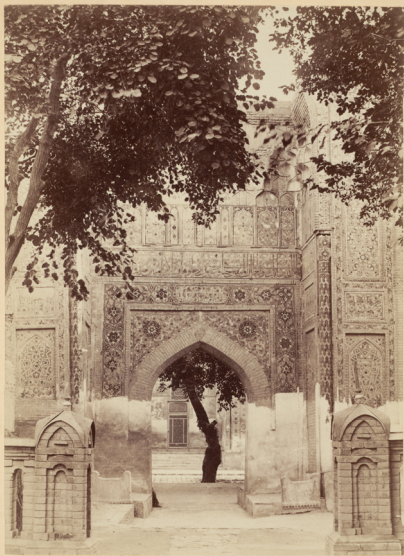
24. Порталь входа въ мавзолей Тамерлана.