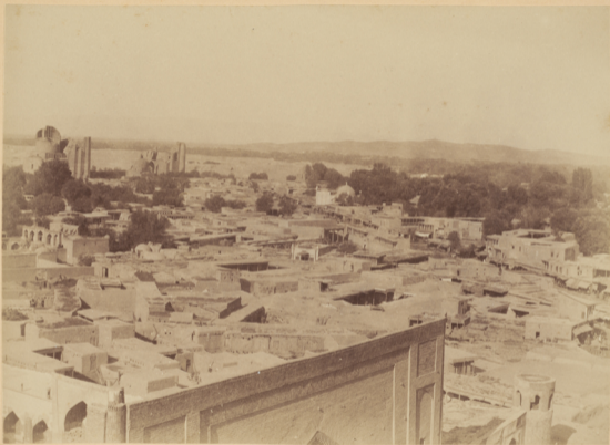
53. Видъ г. Самарканда съ минарета Улугъ-бекъ.