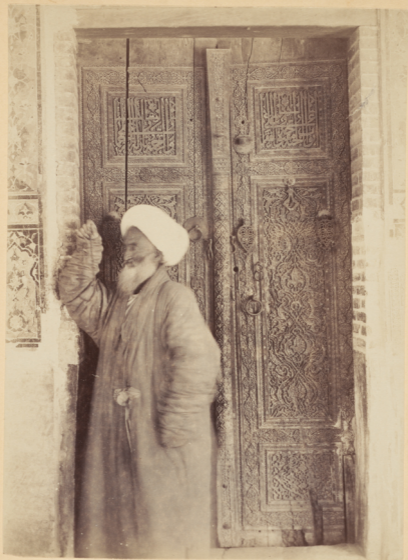
36. Дверь, ведущая въ мавзолей Кусамъ-Ибнъ-Абаса.