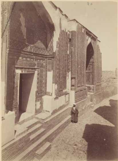
12. Мавзолей на могилѣ Турчанъ-Ана (дочь Эмира Тараганъ) у мечети Шахъ-зинда построенъ въ 773 году геджры (п. Р. X. 1371 году).