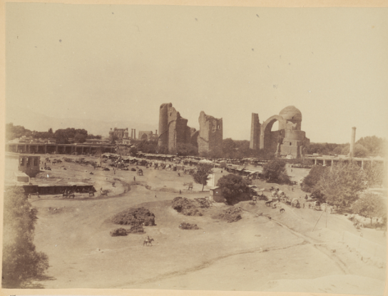
52. Видъ города Самарканда съ мечети Хазретъ-Хызръ.