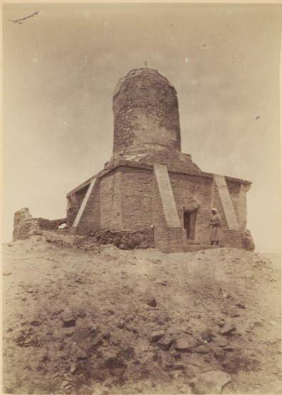
31. Могила Святаго Чупанъ-ата (чупанъ—пастухъ. ата—отецъ). Постройка воздвигнута Тамерланомъ.