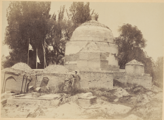
14. Мечеть Ходжа-Абду-дарунъ (Моизитдинъ, сынъ Ходжи-Абду-бюруна) построена у могилы Святаго того-же имени Мирзой-Улугъ-бекомъ въ 845 году геджры (и. Р. X. 1441 году).