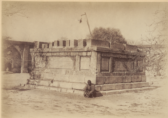
6. Усыпальница 9-ти царствовавших хановъ и ихъ семействъ: Шейбани-хана, умершаго въ 916 году геджры (п. Р. X. 1510 году), сына его Тимурь-Мухаммадь-хана, правнука Нутлукъ-Мухаммадь-Султана и др.