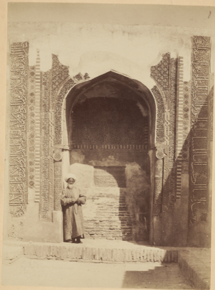
13. Арка, замыкающая узкій корридоръ между мавзолеями у могилы Шахъ-зинда.