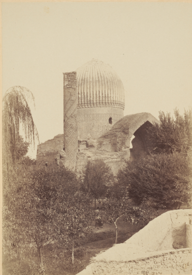
4. Гурь-Эмиръ (гурь—могила, эмиръ—повелитель). Мавзолей на могилѣ Эмира Тимура-Вурягана, т. е. Тамерлана, построенъ въ 807 году геджры (п. Р. X. 1404 году) самимъ Эмиромъ.