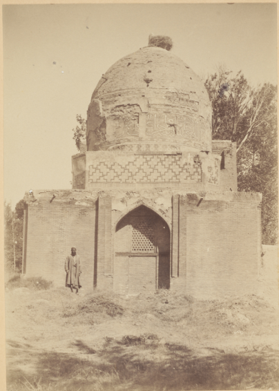
15. Мечеть Ходжа-Абду-бюруиъ (Мухаметъ Якубъ, внукъ знаменитаго Османа) построена у могилы Святаго того-же имени Надиромъ-диванъ-беги въ 1043 году геджры (и. Р. X. 1633 году).