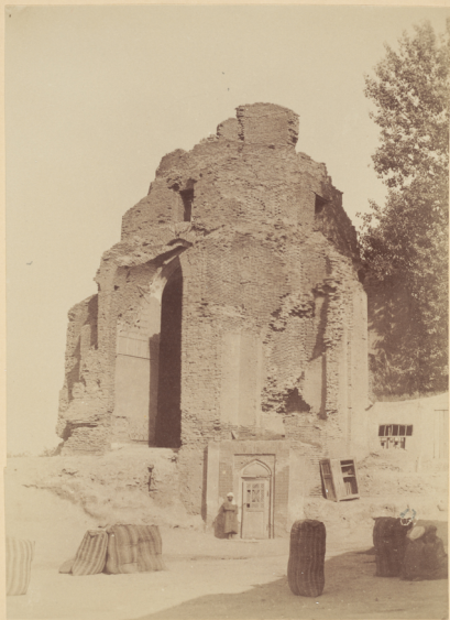
9. Мавзолей на могилѣ Биби-Ханымъ построенъ въ 803 году геджры (п. Р. X. 1400 году) Эмиромъ Тамерланомъ.