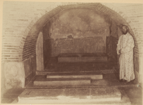
25. Надгробный камень и склепъ въ мавзолей Тамерлана.