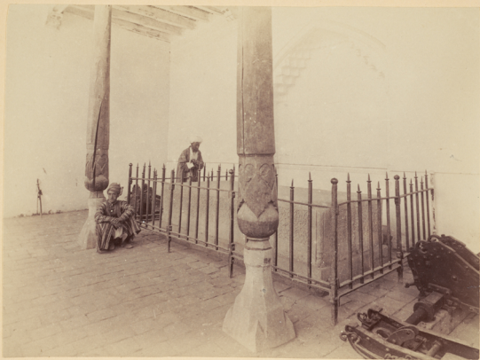
43. Кокташъ (тронъ Тамерлана).