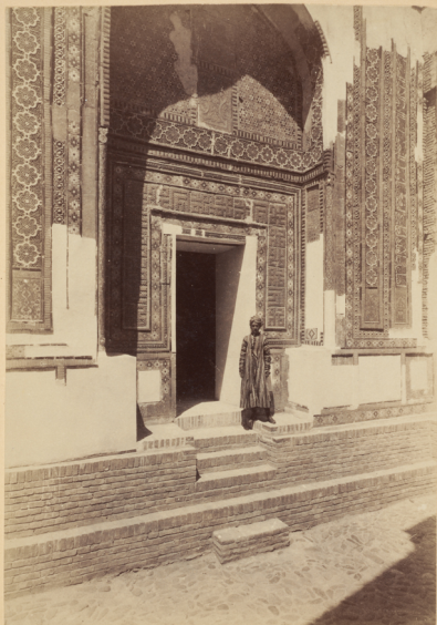
11. Мавзолей на могилѣ Эмира-Зада (Царевича) у мечети Шахъ-Зинда построены въ 799 г. геджры (и. Р. X. 1396 г.).