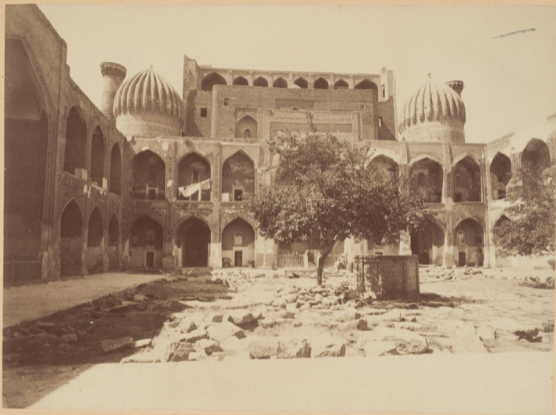
21. Видъ худжръ (келій учащихся) въ мадраса Ширъ-даръ.