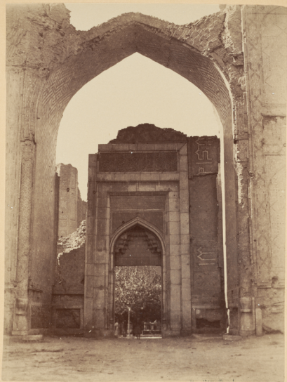
26. Триумфальная арка со стороны базара въ ма- драса Биби-ханьмъ.