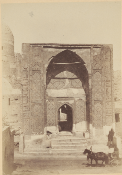
10. Мечеть Шахъ-Зинда (Живой царь) построена Абдуль-Азисомъ (сынъ Мирам-Улугъ-бека) въ 838 году геджры (п. Р. X. 1434 году).