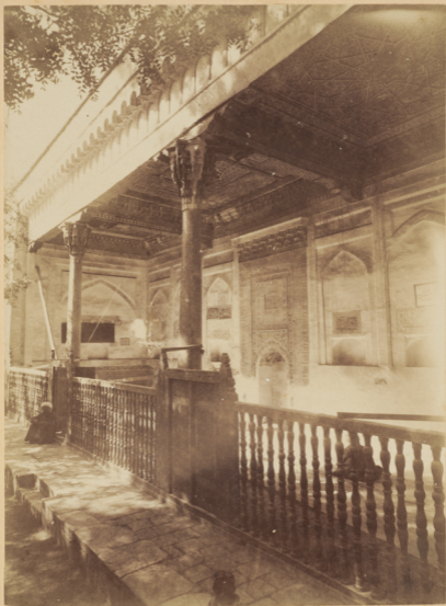
54. Мечеть Надиръ-диванъ-беги (малая) у запад- ной стороны могилы Святаго Ходжи-Ахрара.