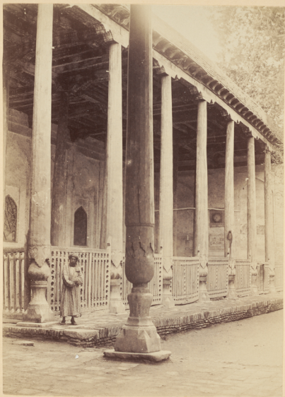
46. Мечеть Магзуми-Агзамъ, построенная въ честь Святаго того-же имени Эмиромъ Ялангушъ-Багадуромъ въ 1028 году геджры (п. Р. X. 1618 году).