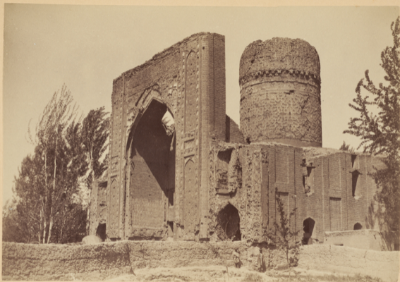
16.. Мавзолей Ишратъ-хана на могилѣ бабушки Тимерлана Сахибъ-Давлять-бена, дочери Эмира-Джалолуджина.