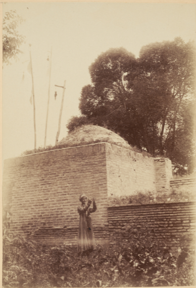
44. Могила Святаго Ходжи-Исмаила , умершаго въ 256 году геджры (п. Р. X. 871 году).