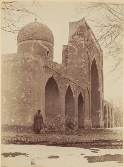
19. Мечеть Намазга построена Надиромъ-мухаммадъ-диванъ-беги около 1040 года геджры (и. Р. X. 1630 году).