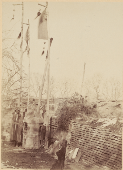
39. Могила Святого Ходжа-Зудмурадъ.