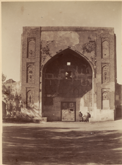
34. Порталь входа въ мадраса Надиръ-диванъ-беги.