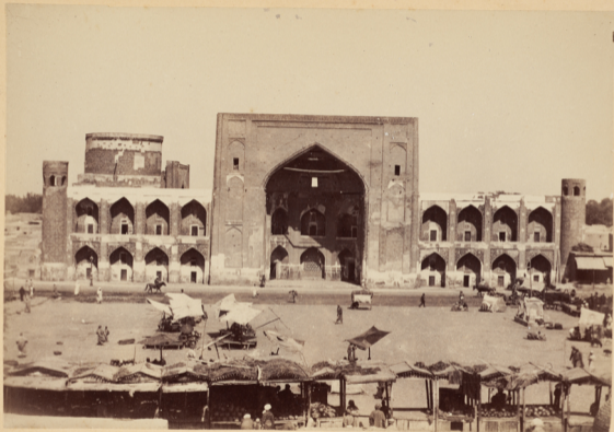
3. Мадраса Тилля-кари (тилля—золото, кяръ—дѣлать) построена Эмиромъ Ялангушъ-Бага- дуромъ въ 1051 году геджры (п. Р. X. 1641 году).