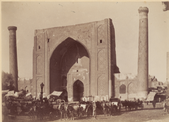
2. Мадраса Улугъ-бекъ построено внукомъ Тамерлана Эмиромъ Мирза-Улугъ-бекомъ въ 823 году геджры (п. Р. X. 1420 году).