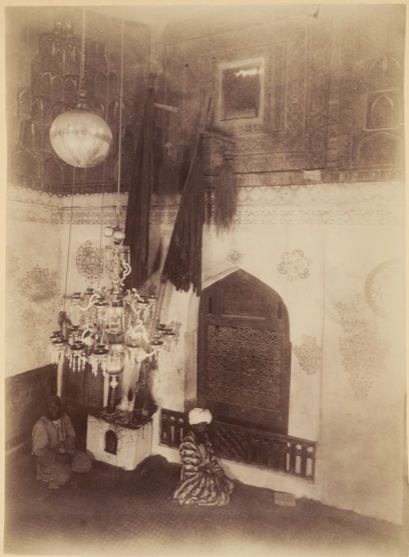
27. Внутренний видъ мавзолея Нусамъ-Ибнъ-Абаса (Живаго Царя), умершаго въ 56 году геджры (п. Р. X. 677 году).