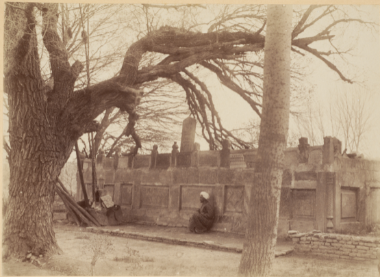
30. Могила святаго Ходжи-Исхана (сынъ Магауни-Агзамъ), умершаго въ 1007 году геджры (п. Р. X. 1598 году).