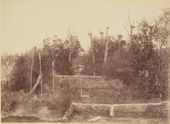
47. Могила Святого Магзуми-Агзамъ , умершаго въ 949 году геджры (и Р. Х. 1542 году).