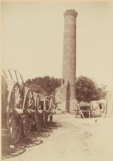
51. Минареть у мадраса Биби-Ханымъ.