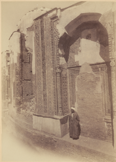
49. Мавзолей надъ могилами: Эмира-Хусейна (племянника Тимурлана), построенъ въ 777 году геджры (п. Р. X. 1375 году) и сестры Тимурлана Шеримъ-бика-ака , построенъ въ 787 году геджры (п. Р. X. 1385 году).