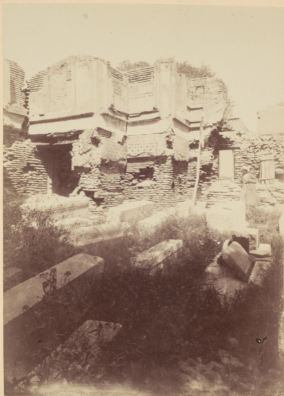
50. Усадьба хановъ: Кучукичи-Хана , умершаго въ 937 году геджры (п. Р. X. 1530 году), его сыновей Абусанди и Абдулла Багадурь-Хановъ , умершихъ въ 910 и въ 947 годахъ геджры (п. Р. X. 1533 и 1540 годахъ), внука Султанъ Саида-Белибурь-Хана и др.