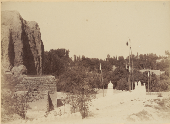
20. Могила Святаго Ходжи-Даніяра, сподвижника Кусамы-Ибизъ-Абаса, умершаго въ 56 году геджры (п. Р. Х. 677 году).