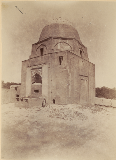
42. Рухабатъ, могила Святаго Бурханитдина . Мавзолей построень Тамерланомъ.