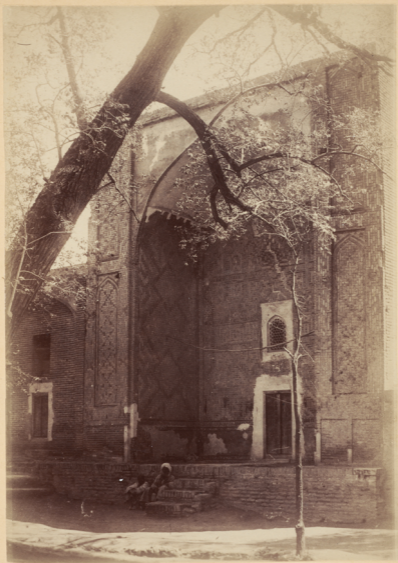
41. Видъ мечети у могилы Святого Ходжи-Абду- даруна съ сѣверной стороны.