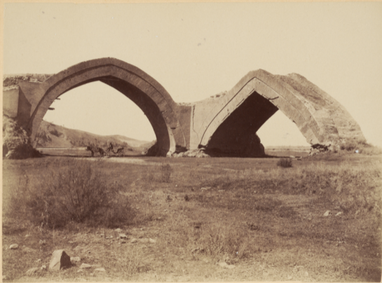
38. Арки на рѣкѣ Зеравшанѣ, построенныя въ XV столѣтїи.