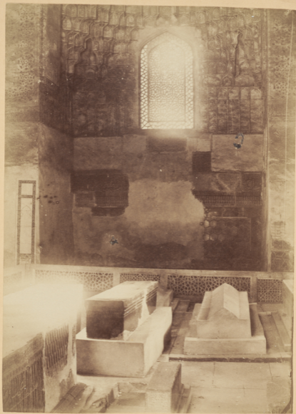
5. Внутренній видъ Мавзолея Тамерлана.