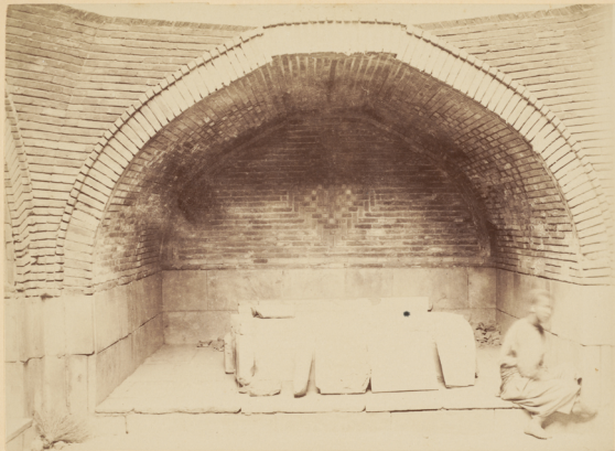
29. Внутренній видъ Мавзолея Биби-Ханымъ