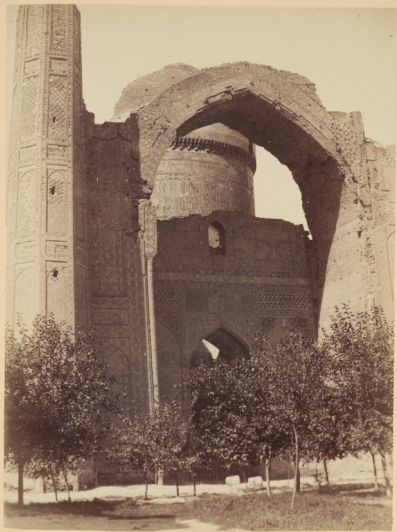
8. Глазная арка и куполь мечети Биби-Ханымъ