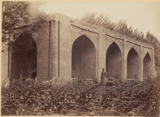
45. Мечеть Ходжа-Пемайлъ.