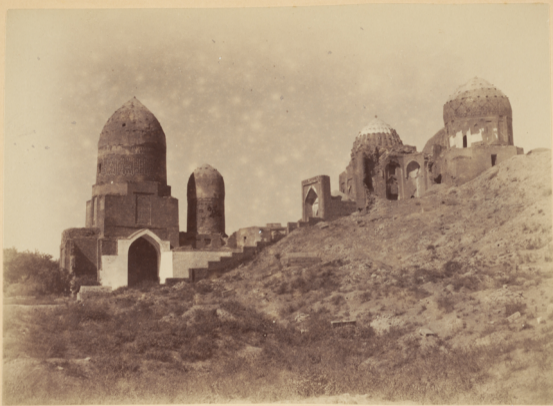
35. Общій видъ мавзолеевъ у мечети Шахъ-Зинда.