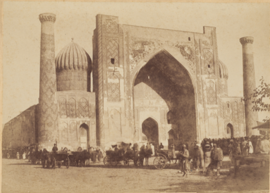
1. Мадраса Ширъ-даръ (Ширъ—левъ, даръ—имѣющій) построено Эжиромъ Ялангтушъ-Бага- дуромъ въ 1028 году геджры (п. Р. X. 1618 году).