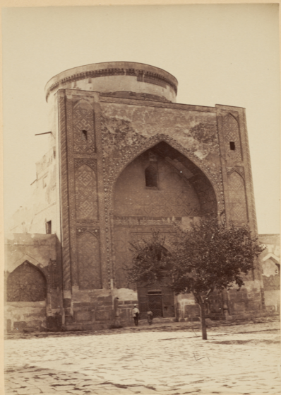
22. Фронтонъ главнаго входа въ мечети Тилля-кари