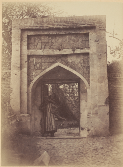
48. Порталъ входа на могилу Магзуми-Агзамъ .