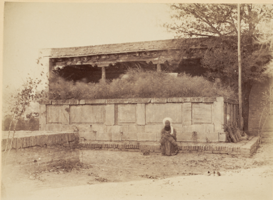
33. Могила Святого Ходжи-Абду-бюруна.