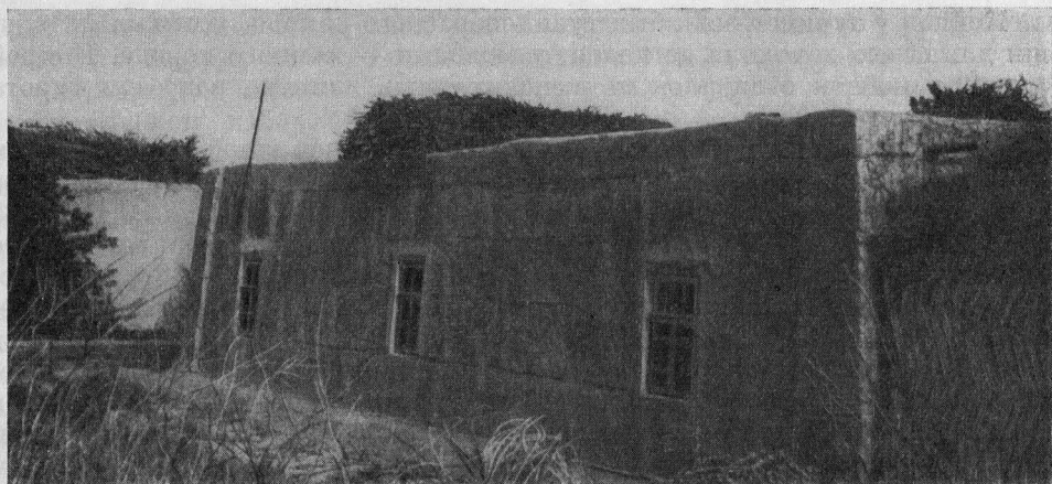
Рис. 3. Новый тип дома колхозника

расстелены кошмы, а у более зажиточных — ковры 32 . Наши информаторы указывают также на наличие в жилище стопки постельных принадлежностей, сложенных на специальной примитивной подставке или шкафчике шкафжык , мешков с запасами продовольствия, подвешенной детской колыбели салланчак и некоторых других предметов домашнего обихода 33 .