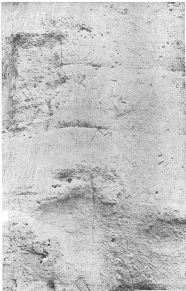
Рис. 5. Верхняя латинская надпись из Кара-Камара

скальный «козырек», в настоящее время обвалившийся. Длина надписи — 43 см, наибольшая высота букв, в частности, \rho и \pi — до 15—19 см, глубина — 0,5—1 см. (рис. 3). Прежде надпись была покрыта слоем «пустынного загара», который сейчас отслоился. По мнению Ю. Г. Виноградова, видевшего фотографию надписи, ее можно читать \rho\iota\lambda\omicron\zeta\epsilon\theta\eta(\upsilon\varsigma) «Рипос поставил / посвятил». Ю. Г. Виноградов склонен датировать эту надпись I—II вв. н. э., но не исключает возможности отнесения ее к позднему эллинизму. Того же чтения, за исключением предпоследней буквы, придерживается специалист по античной эпиграфике Ю. Б. Устинова, осмотревшая вместе со мной эту и другие надписи в Кара-Камаре в мае 1988 г. (см. ее статью в настоящем номере ВДИ). Рис. 3,4 — вклейки.