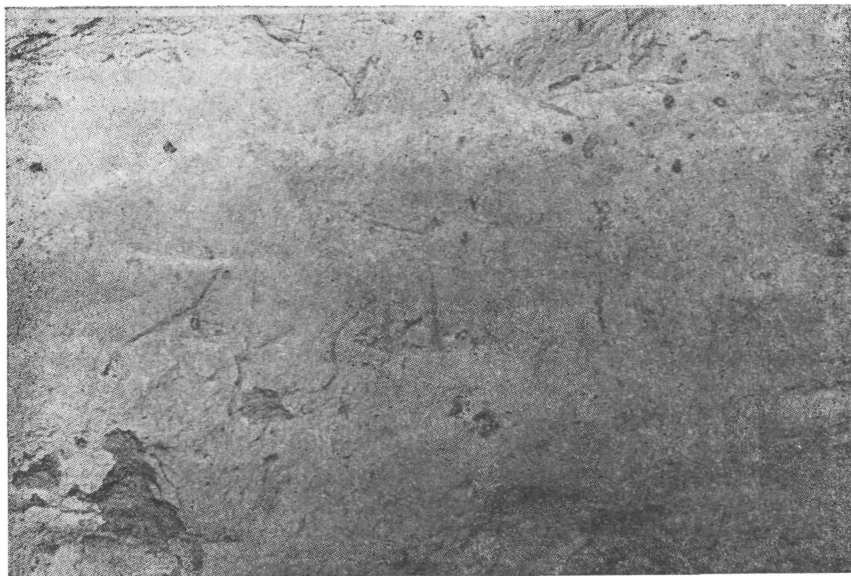
Рис. 2. Бактрийская надпись из Кара-Камара

Даты следующие: 584 г. х. (1187—1188 гг. н. э.; 837 г. х. (1433—1434 гг. н. э.); 949 г. х. (1542—1543 гг. н. э.). Кроме того, перед входами в пещерные сооружения имеются поздние арабские надписи XIX — начала XX в., содержащие религиозные формулы типа «бисмалы» и «калимы».