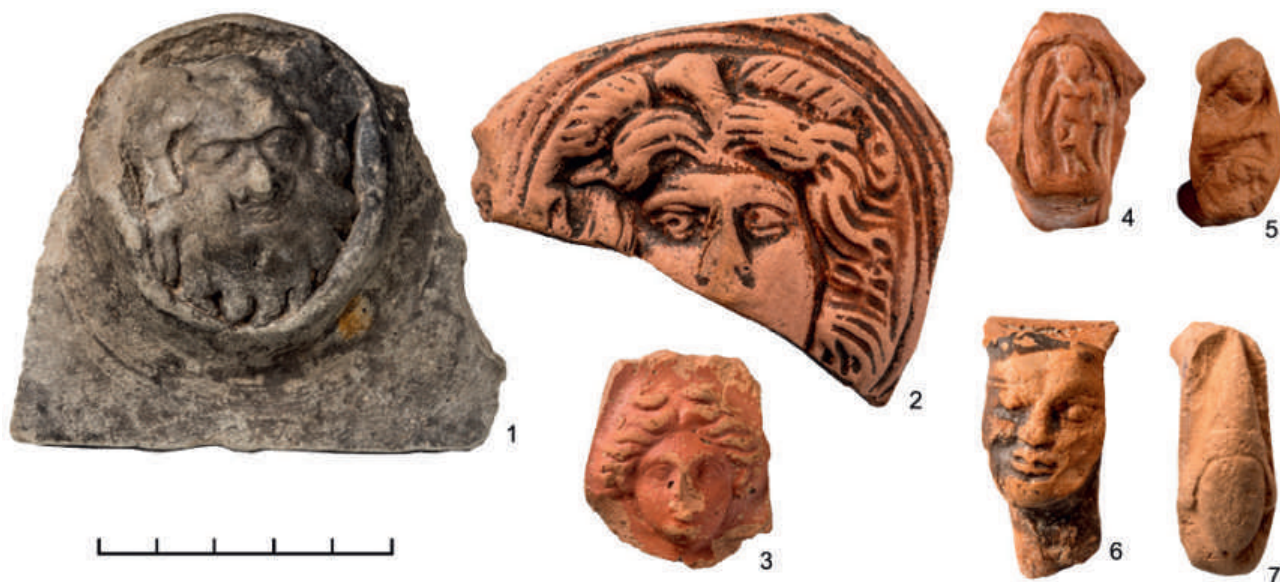
Рис. 2.1. Терракота Центрального (Самаркандского) Согда. Налепы и оттиски. Хранение Государственного Эрмитажа (Санкт-Петербург)