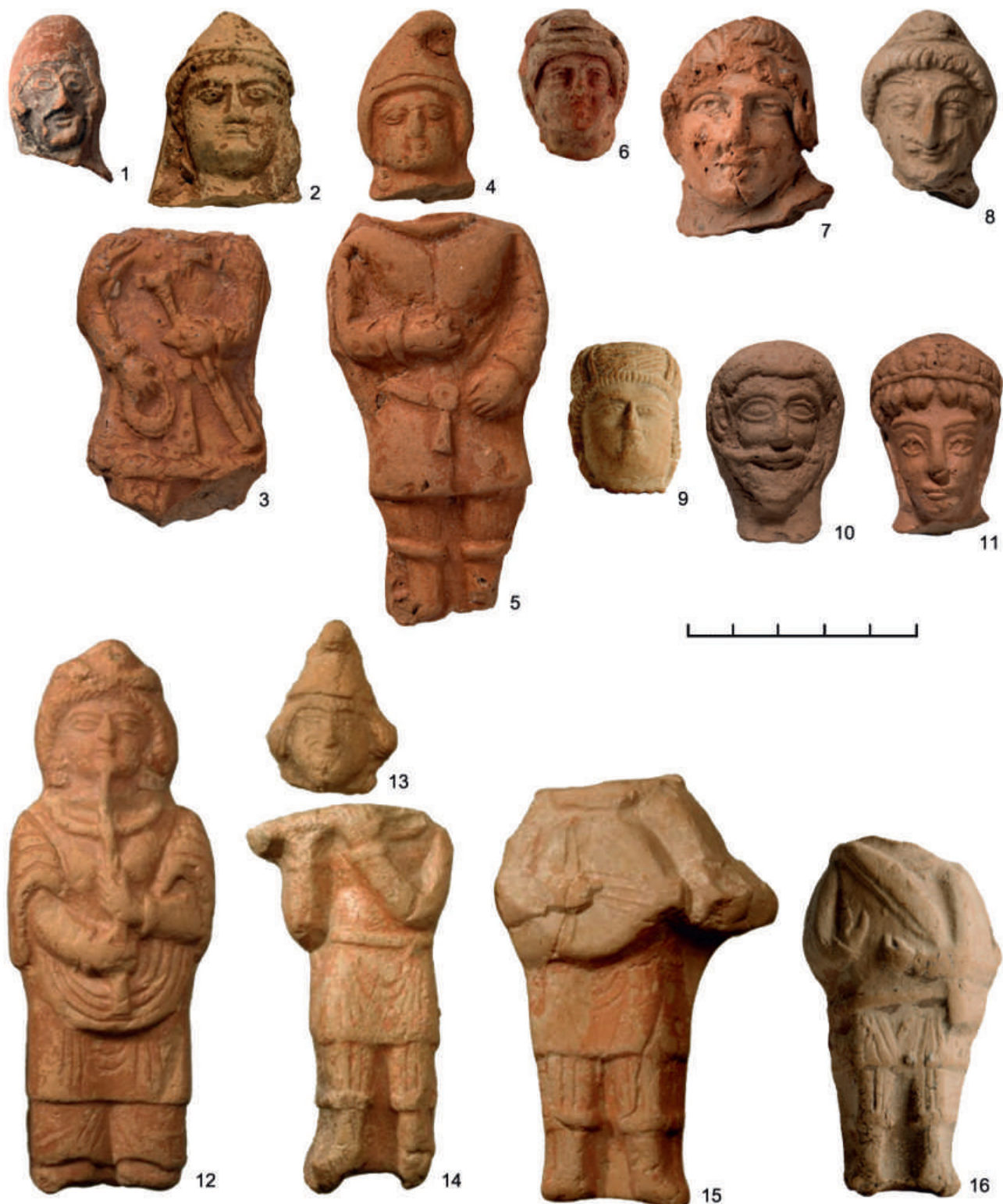
Рис. 2.III. Терракота Центрального (Самаркандского) Согда. Мужские персонажи, музыканты. Хранение Государственного Эрмитажа (Санкт-Петербург)