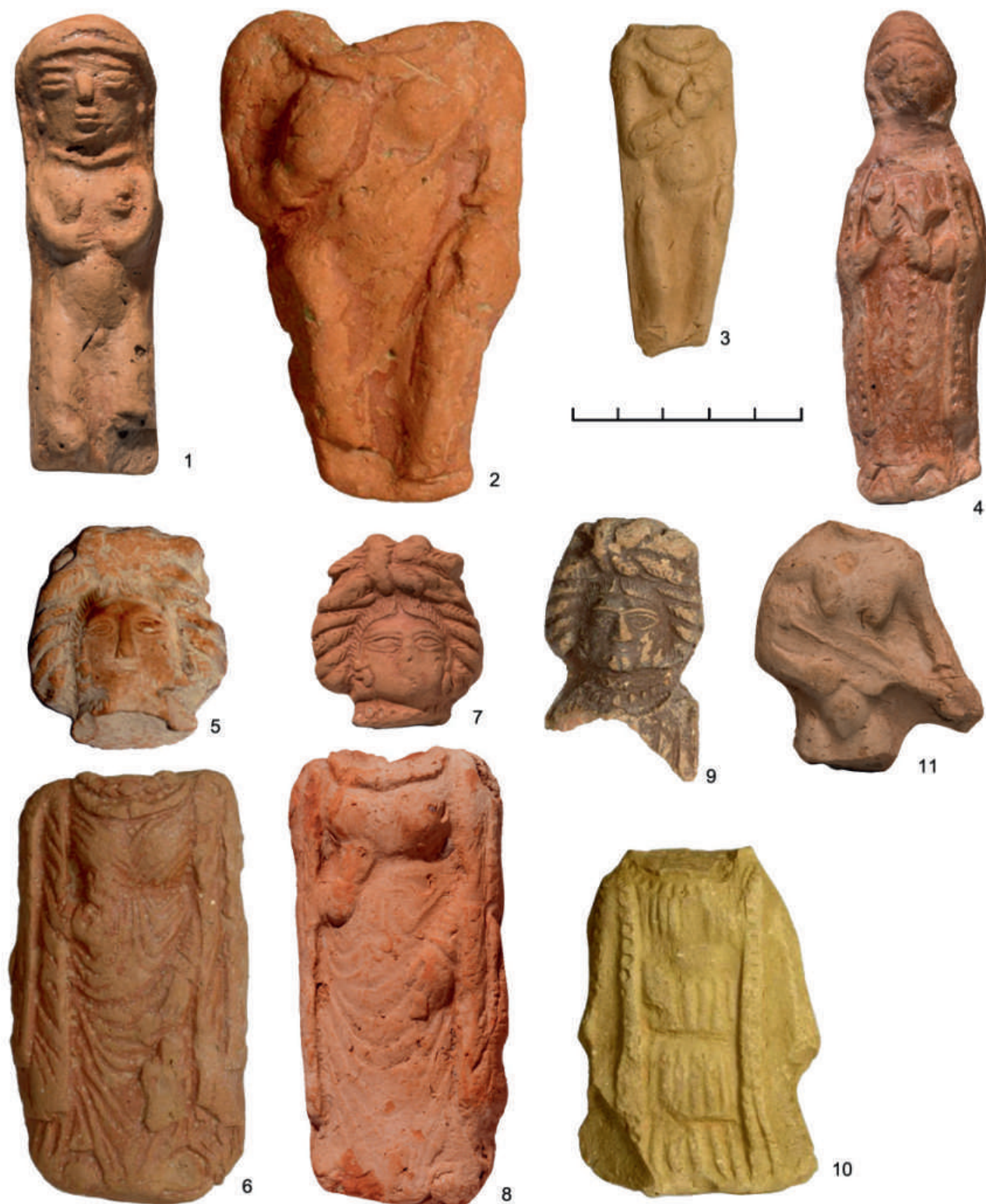
Рис. 2.И. Терракота Центрального (Самаркандского) Согда. Женские персонажи. Хранение Государственного Эрмитажа (Санкт-Петербург)