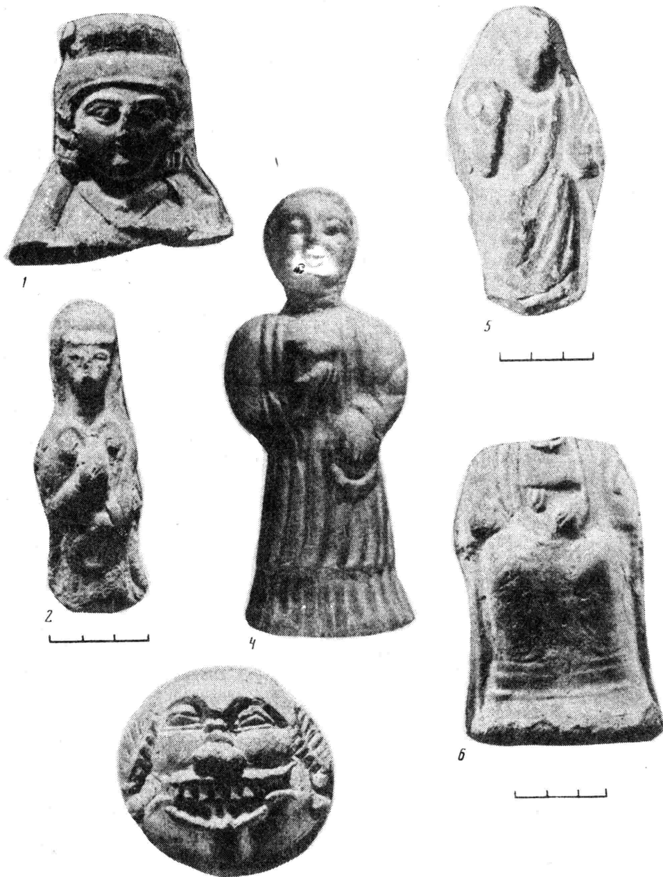
Р и с. 2. Образцы корoplastики кушанской и раннесредневековой эпохи

1 - терракотовый бюстик местной богини из Джаркургана КИ 1622-2; 2, 6 - статуэтка богини с инвенстатуарным кольцом, сидящая богиня на троне (Зартепе); 3, 4 - маска Киргимукси, адорантка (Хайрабадтепе) (ИМ); 5 - статуэтка богини из Саксанохура (ИИАЭ ТаджССР)